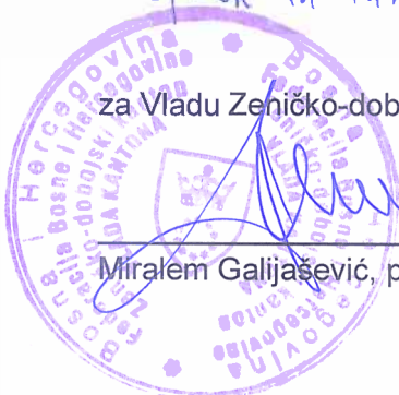
Miralem Galijašević, premijer